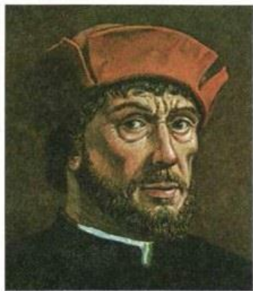
Рис. 14. Хуан Себастьян Элькано